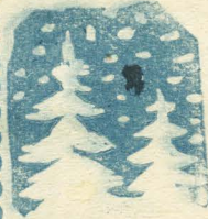
Наша новогодняя анкета