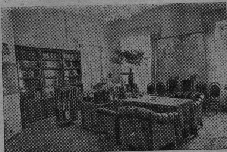
Москва, Кремль. Рабочий кабинет В. И. Ленина.