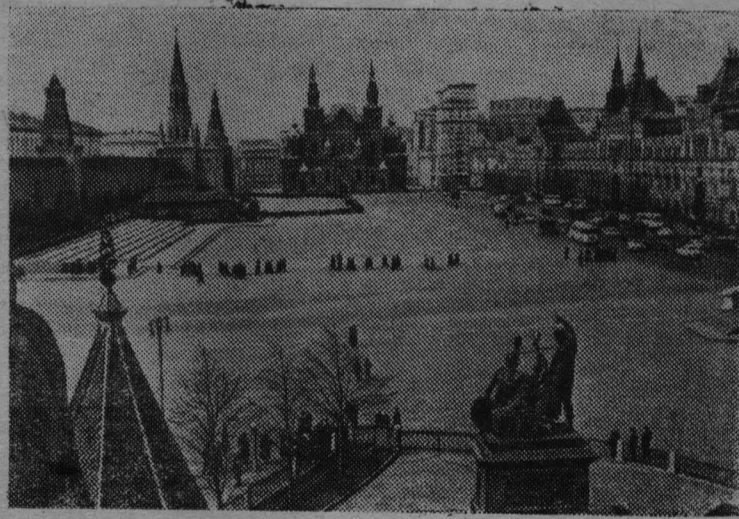
Москва, Красная площадь.