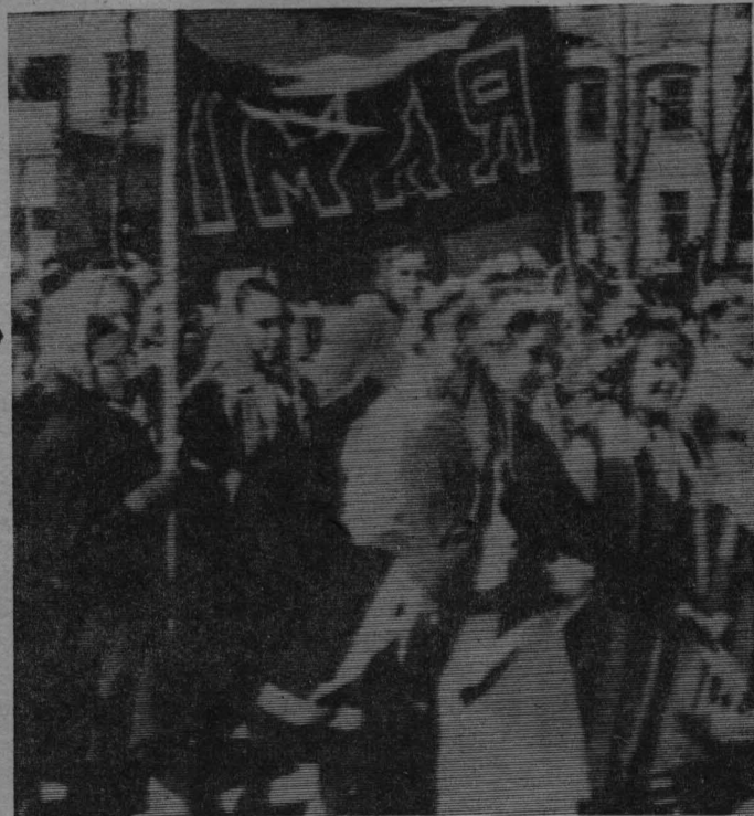
На снимке: учащиеся школы № 13 в праздничной колонне.