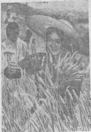
В Китайской Народной Республике идет уборка урожая осенних сельскохозяйственных культур.

В северных провинциях страны, вдоль среднего и нижнего течения реки Хуанхэ, выращено много кукурузы, гаоляна, проса. Хорошие урожаи ожидаются также в других провинциях.