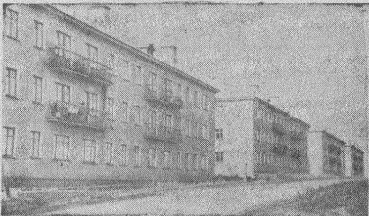
Когда в Москве проходил XXI съезд КПСС, этих домов на плане города не было. В одиннадцатом квартале Соцгородка их воздвигли за два с лишним года строители Полысаевского управления.