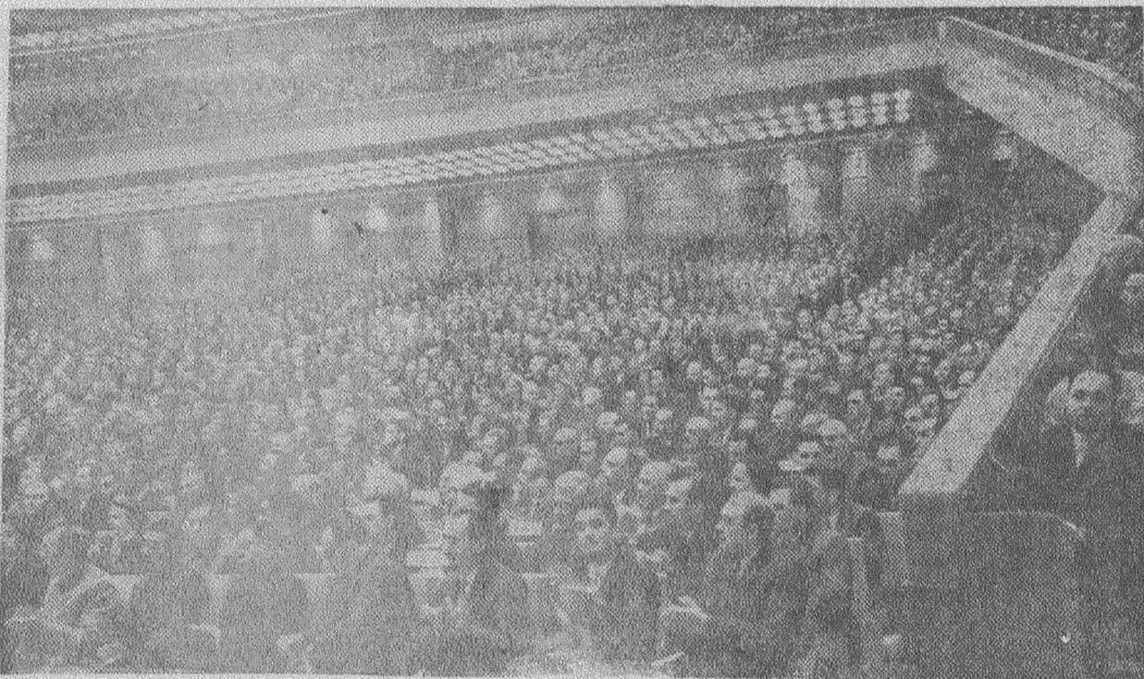
МОСКВА. XXII съезд Коммунистической партии Советского Союза.

Осуществляя требования новой Программы и Устава КПСС, резюмирует свою речь тов. Ефремов, партийная организация будет неустанно повышать уровень организаторской и идеологической работы, поднимать инициативу и