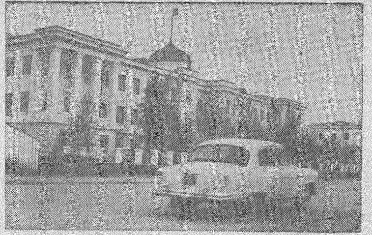
Указом Президиума Верховного Совета СССР Тувинская автономная область преобразована в Тувинскую Автономную Советскую Социалистическую Республику. На снимке: здание обкома КПСС в Кызыле — столице республики.