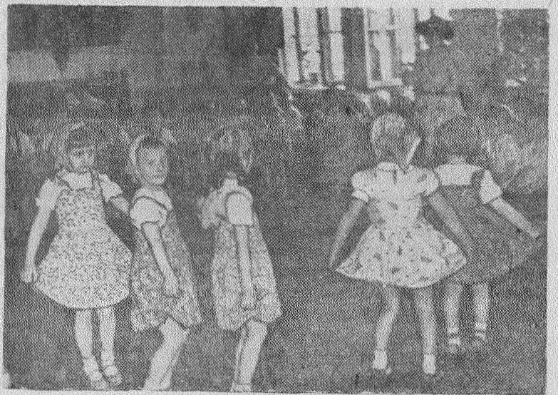
Утренник в детском саду шахты имени 7 ноября