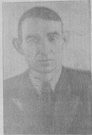
Ф. Ф. ЛОСЕВ.