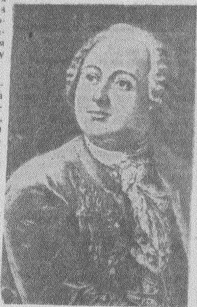
М. В. ЛОМОНОСОВ.

Огромно значение его трудов в области геологии, в познании истории и строения Земли, ее минеральных богатств, в развитии науки о почве. В своих сочинениях Ломоносов показал себя борцом против религии, против библейских мифов. Так, он раскритиковал библейскую легенду всемирного потопа; доказал, что образование земных слоев происходило и происходит непрерывно; правильно оценил окаменелости как остатки живых организмов; выяснил органическое происхождение торфа, каменного угля, нефти, янтаря и др.