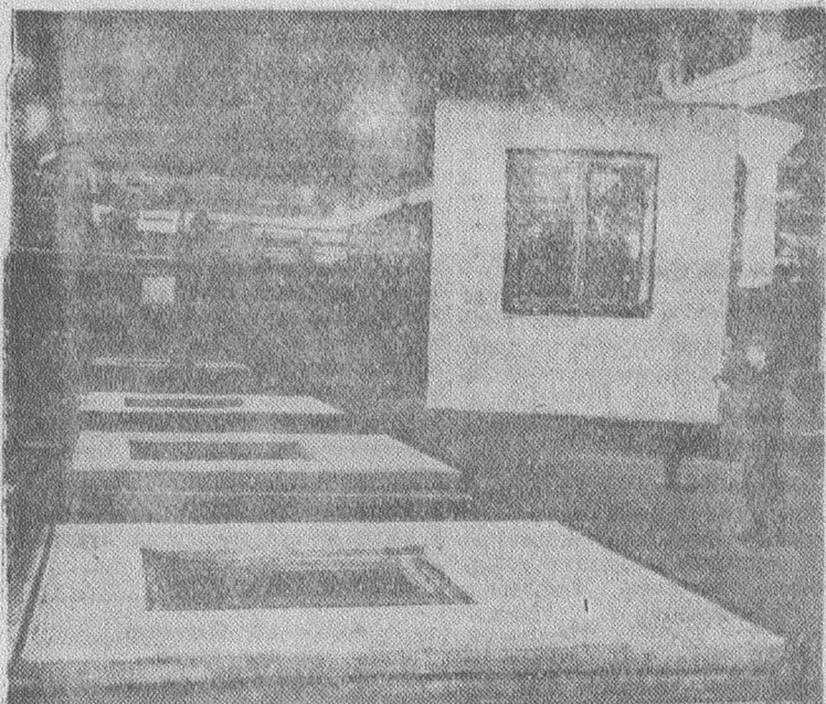
Красноярск. Коллектив домостроительного комбината, сооруженного недавно, осваивает проектную мощность предприятия. Оно будет давать 140 тысяч квадратных метров жилой площади в год.

неподвижной рамы под нижней кареткой со щеками и гидродлиндром для подъема. Небольшая высота машины позволяет заводить контейнеры прямо в склады и цехи. Грузоподъемность контейнеровоза — 2500 килограммов, скорость движения 40 километров в час. Создан он в бюро коммунальных машин Горьковского автозавода.