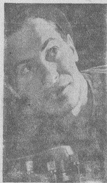
Ленинград. Замечательно трудятся машиностроители завода «Русский дизель». Многие производственники уже выполнили 5-6 и даже семь годовых норм.