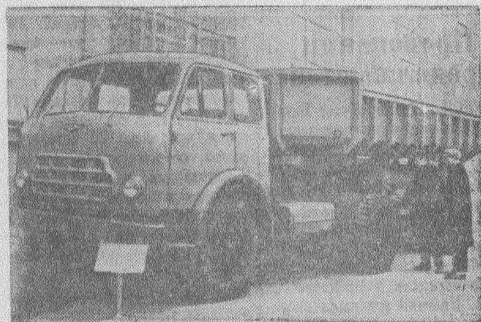
Москва. На Выставке достижений народного хозяйства СССР демонстрируется новый автомобильный тягач «МАЗ-504 Б» грузоподъемностью 12,5 тонны. Дизельный двигатель автомашин развивает мощность до 180 лошадиных сил, максимальная скорость 75 километров в час.

● Московский институт «Гипромез» выполнил проектное задание строительства Западно-Сибирского металлургического завода. Проектная мощность предприятия-гиганта по сравнению с ранее намечавшимися цифрами увеличится: по чугуна — в 1,6 раза, по стали — в 1,6 раза, по прокату — в 1,7 раза.