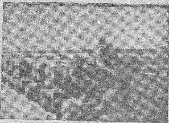
Румынская Народная Республика — страна развитой текстильной промышленности. Через несколько лет крупнейшее текстильное предприятие Бухареста «Филатура ромынеаска де Бумбак» нельзя будет узнать. Здесь возводятся новые цеха, часть которых уже вошла в строй. Большинство установленных машин отечественного производства.

На снимке: установка оборудования в новом цехе.