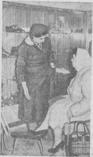
Молдавская ССР. Колхозы Бульбокского района решили создать в каждом селе образцовый универсальный магазин. Недавно новый универмаг открылся в селе Анены.

Всего с начала 1960 года в городах и селах республики открыто более 600 магазинов, киосков, столовых, чайных. На расширенье торговой сети ассигновано средств в полтора раза больше, чем в 1959 году.