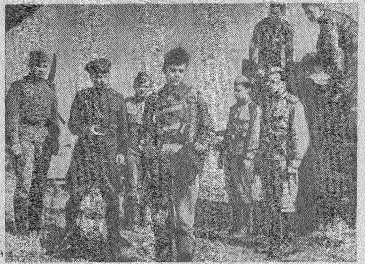
Кадр из новой кинокартины «Прыжок на заре» производства киностудии имени М. Горького. Фильм поставлен режиссером И. Луккинским по сценарию Г. Березко.