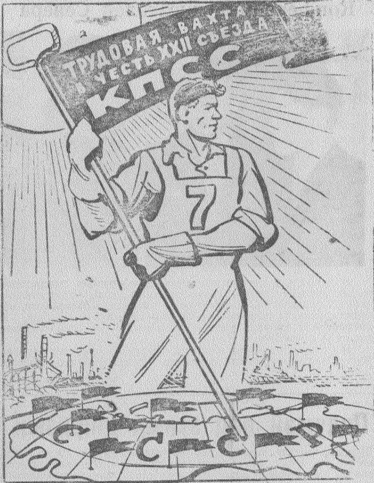
Рис. В. Жарнинова.