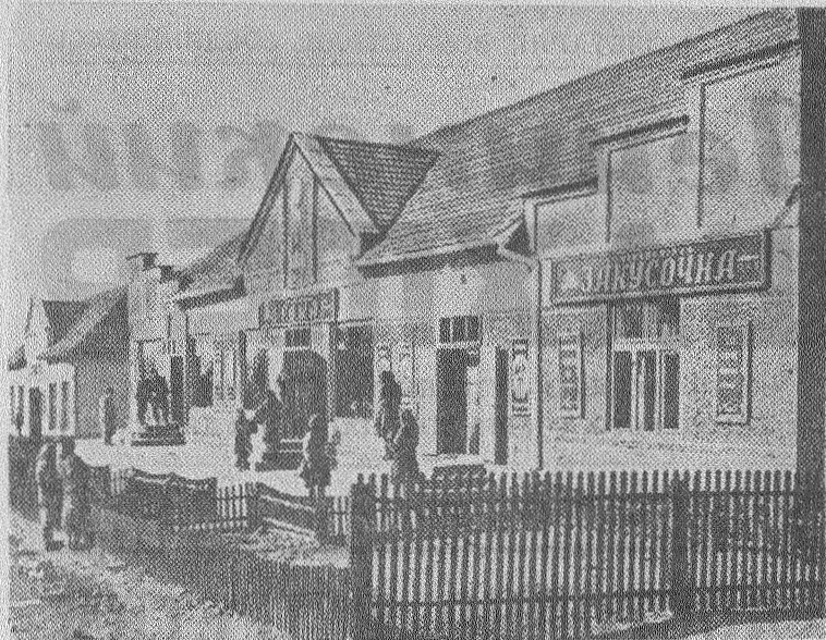
Закарпатская область. Работники Иршавского райпотребсоюза улучшают торговлю на селе.

Забывла газета «Кировец» об этом важном и нужном участке своей работы. А ведь вопросы экономии — важнейшее звено в работе предприятия. Надо полагать, партийный комитет шахты поможет газете стать пропагандистом и организатором борьбы шахтеров за снижение себестоимости угля, за рентабельную работу предприятия.