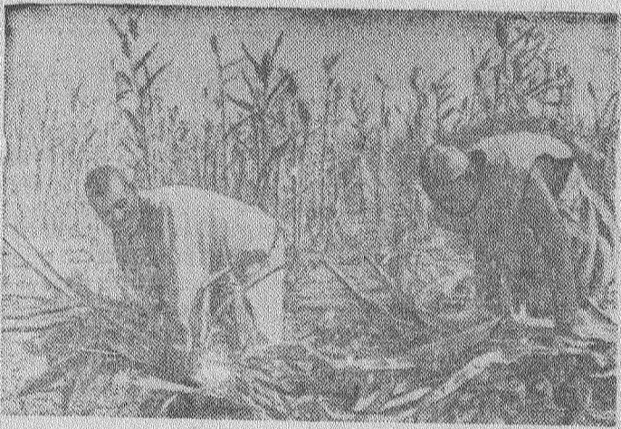
Республика Чад. Сорго—одна из ведущих сельскохозяйственных культур в стране. На снимке: уборка сорго.