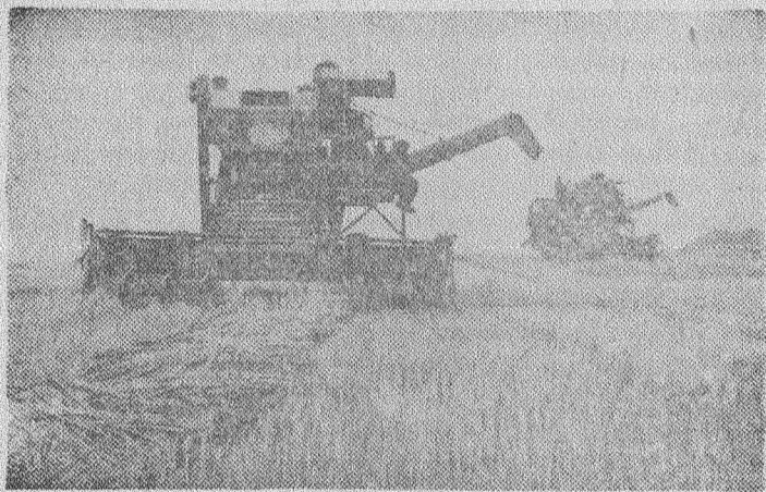
Дагестанская АССР. На полях республики идет уборка зерновых культур. Многие механизаторы во-дят уборочные агрегаты на по-вышенных скоростях.

Начало второй половины семи-летки кубанские хлеборобы встречают богатым урожаем. Автопоезда уже доставили в за-кром Родины около 15 милли-онов пудов зерна.