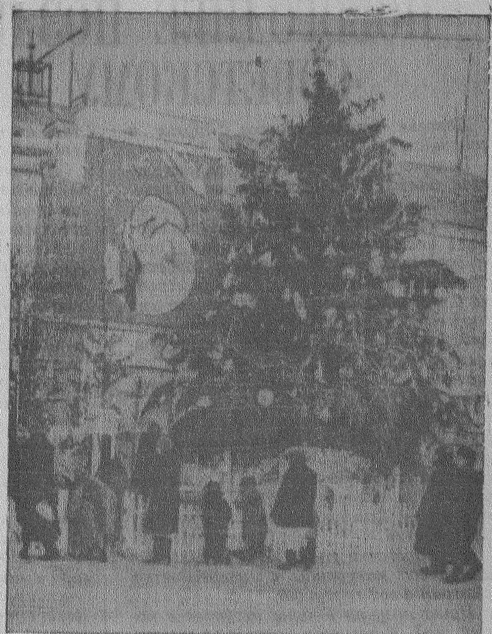
Новый год пришел в город с веселым хором народных праздничных елок. На снимке: новогодняя елка у треста «Кузбассуглегеология».