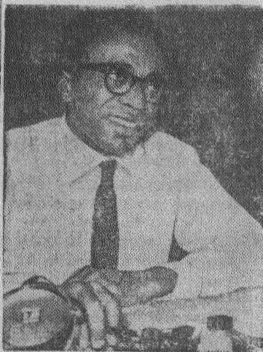
На этом снимке, сделанном в Стэнливиле в прошлом году, выдающийся борец за свободу Африки Антуан Гизенга в своем рабочем кабинете.