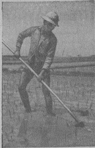
Индонезия. Крестьянин на рисовом поле. В стране получают по три урожая риса в год.

В Орানে обстановка напоминает настоящий фронт. Практически город разделен на две части: европейскую и арабскую, между которыми проходит полоса «ничейной» земли. «Ультра» из европейской части города часто устраивают бандитские налеты на арабские кварталы, обстреливая дома и жителей из автоматов. Все это происходит при явном попустительстве полиции и так называемых «сил поддержания порядка».