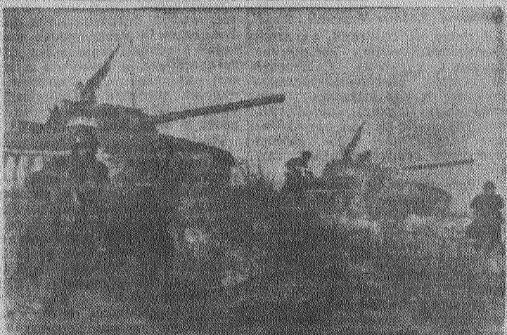
На снимке: на тактических учениях.