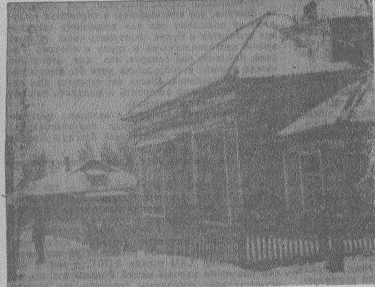
Новый магазин в поселке шахты «Польсаевская-1».

НА избирательном участке № 25 в полном составе собралась участковая избирательная комиссия. Она рассмотрела вопросы о состоянии агитмассовой работы с избирателями и о подготовительной работе по проведению дня выборов в Верховный Совет СССР. Было установлено, что, несмотря на проведенные два семинара с агитаторами (2-го и 21 февраля), проверка списков избирателями проходит очень медленно. Комиссия решила обратить на это самое серьезное внимание.