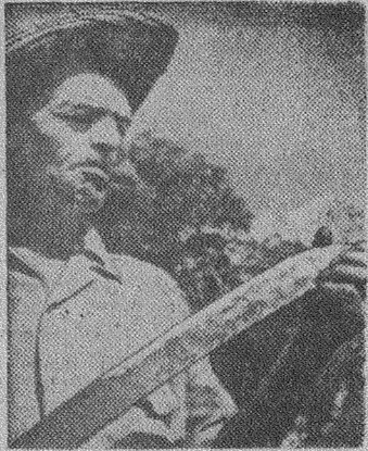
Республика Куба. Крестьянин с мачете — ножом для резки сахарного тростника.