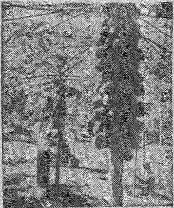
Китайская Народная Республика. На плантации папайи (длинное дерево) в провинции Юньнань. Фото Слюй Синь-яо.

А. И. Микояна сопровождают: заместитель министра иностранных дел СССР А. Л. Орлов, заместители председателя Государственного комитета Совета Министров СССР по внешним экономическим связям А. И. Алиханов и Д. Д. Дегтярь и другие официальные лица. ТАСС.