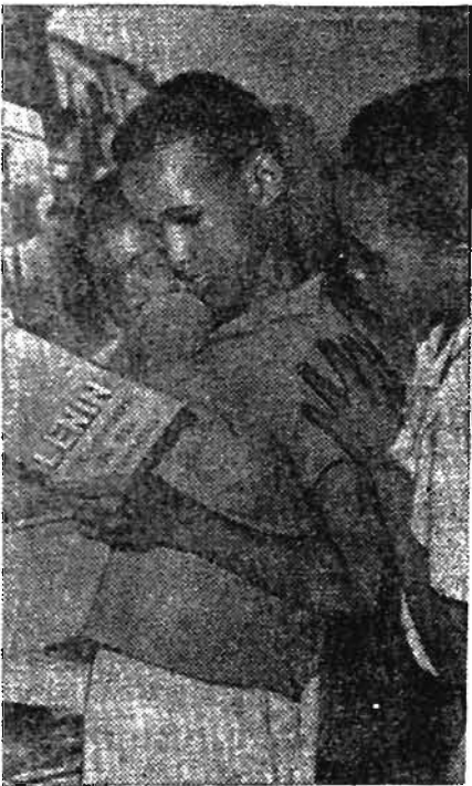
Юные кубинцы в библиотеке.