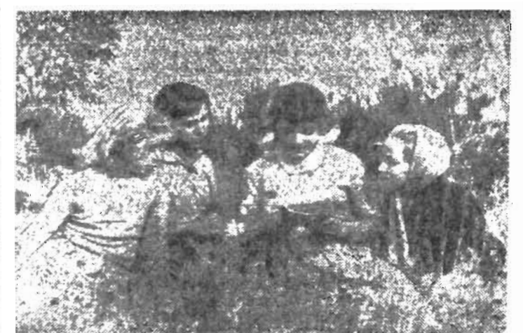
Интересная книга.

СБЕРЕГАТЕЛЬНЫЕ кассы города приступили к оплате выигрышей по билетам денежно-вещевой лотереи третьего выпуска 1963 года.