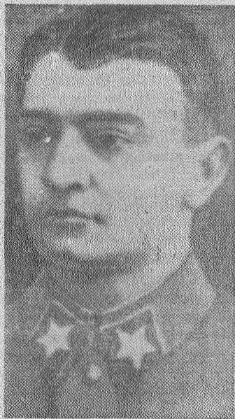
Тухачевский Михаил Николаевич (1893—1937 гг.) — советский военный деятель, Маршал Советского Союза.