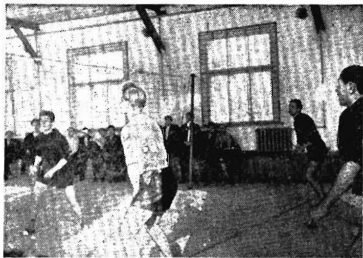
Замечательный спортивный зал получили недавно горняки шахты «Полысаевская-1», светлый, просторный. Есть где развлекаться спортсменам.

Сейчас в новом зале проходит зимняя общешахтовая спартакиада.