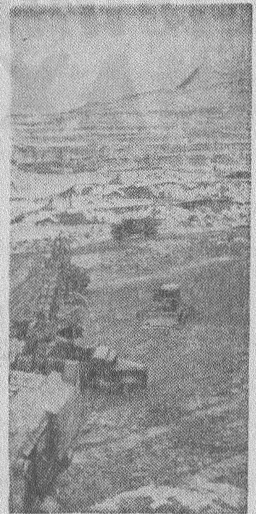
На снимке: вид на рудник открытых работ.

Усть-Каменогорск. Эта гигантская выемка напоминает загадочный лунный кратер... Создана она руками людей, сооружающих в горах Алтая Зырянский рудник открытых работ. Предприятие войдет в строй действующих в конце 1965 года. Здесь вынута уже свыше 20 миллионов кубических метров скрышных горных пород, под толщей которых лежат полиметаллические руды. Строители рудника — особо важной стройки пятого года семилетки — включились в соревнование за досрочное выполнение годового задания.