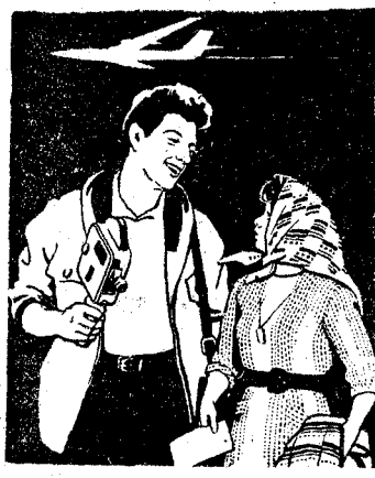
(Производство киностудии «Ленфильм»)