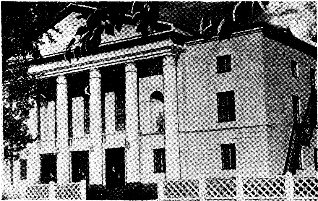
На снимке: новый Дворец пионеров. Читайте о нем на 2-й странице.