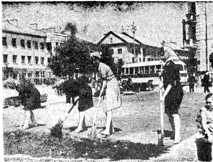
Учащиеся педагогического училища работают на благоустройстве города.

Мы часто ждем. Часто ждем зря. Пусынякое дело можно выполнить за двадцать минут, мы расходует час. Зачем? Никто на это не дает ответа.