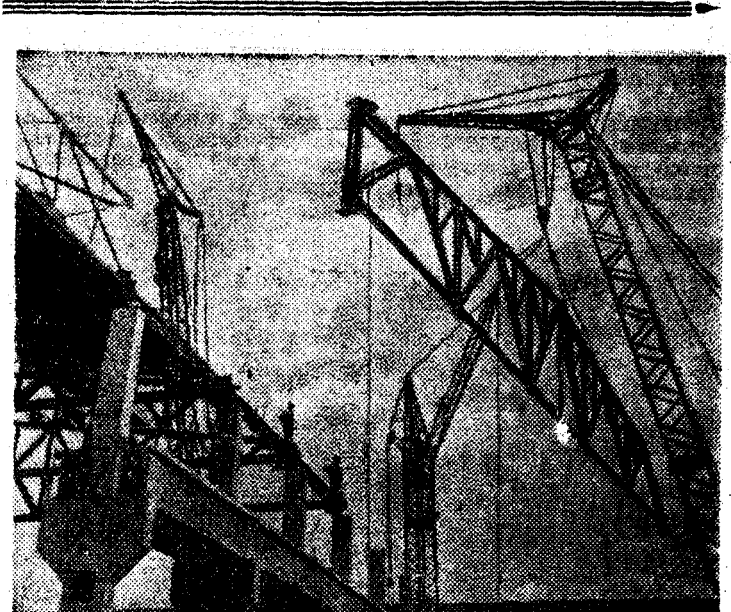
Набирают темпы строители Чебоксарского химического комбината. Идет монтаж оборудования в цехе красителей, растет корпус для производства гербицидов. Скоро первая очередь гиганта большой химии Чувашии вступит в строй.

На снимке: монтаж корпуса гербицидов.