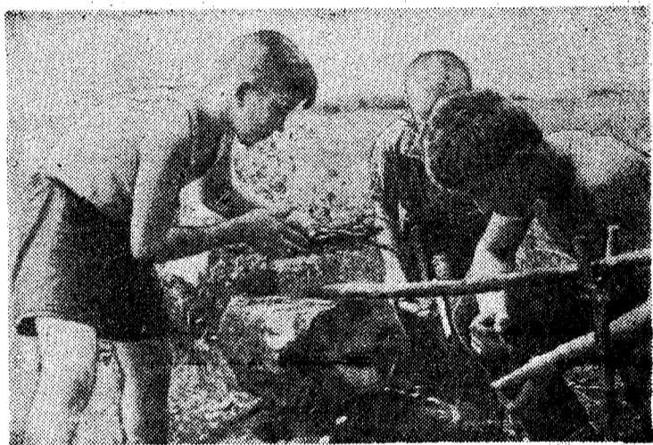
Последняя спичка.