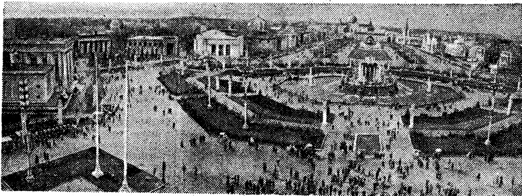
Пять лет назад в Москве была открыта постоянная Выставка достижений народного хозяйства. На снимке: вид на выставку.

Нашими строителями уже много сделано для удовлетворения трудящихся благоустроенной жилой площадью. Однако впереди в этом направлении еще очень много работы. Прежними методами строительства жилищной проблемы решить нельзя. Партия определила главное направление в жилищном строительстве — курс на всемерную индустриализацию домостроения, перевод строительства жилья на конвейер. Дома должны изготавливаться на заводе, а на строительной площадке лишь собираться. При этом условии можно строить быстро, дешево и добротно. Уже сейчас таким способом возводятся дома во многих наших городах. В Ленинграде,