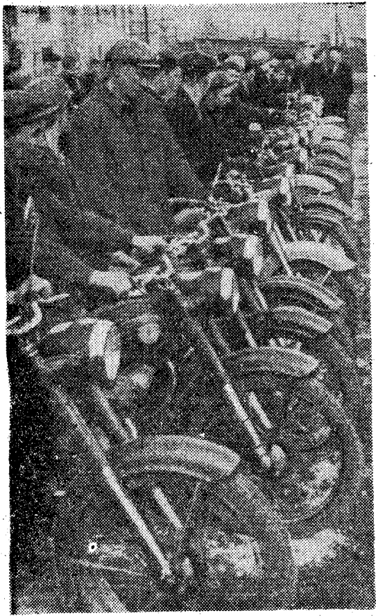
В связи с переходом на 5-дневную рабочую неделю горняки шахты им. Ярославского отдыхают два дня подряд. Это время шахтеры стараются провести с пользой. Недавно, например, шахтовый комитет ДОСААФ организовал соревнования по фигурному вождению мотоциклов. На снимке: перед стартом.