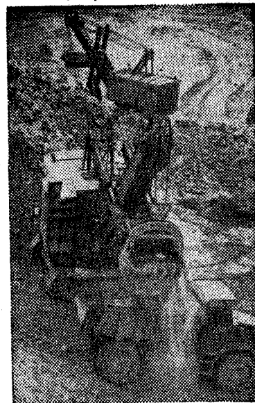
Казахская ССР. Горняки рудника «Аксай» Каратауского горнохимического комбината с каждым днем увеличивают добычу фосфоритов.