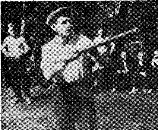
На протяжении недели, с 25 июня по 1 июля, в нашем городе проходили соревнования

областного совета ДСО «Труд» по городкам. Спортсмены многих городов Кузбасса приняли участие в этих соревнованиях.