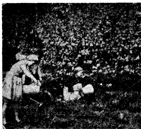
Юннаты школы № 34 имеют в своем распоряжении хороший плодоягодный сад, где они с удовольствием проводят время весной, летом и осенью.