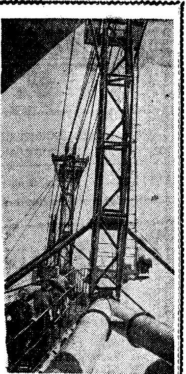
Кустанайская область. Десять эшелонов сверхплановой руды отправили горняки Соколовско-Сарбайского горнообогатительного комбината. В следующем году комбинат достигнет проектной мощности. Новая база черной металлургии станет основным источником сырья для металлургических заводов Казахстана, Урала и Сибири.