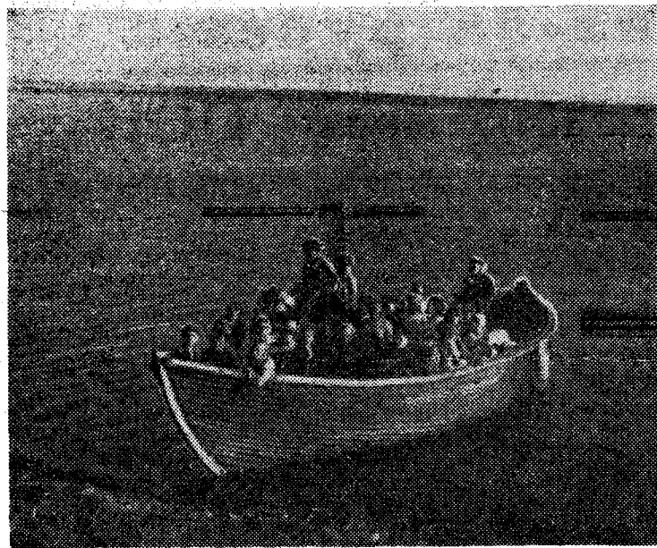
На снимке: ребята готовятся в поход на шлюпке.

«ПОБЕДА» Новый художественный фильм КУБА 1958 г. Сеансы: 12-30, 4-30, 6-10, 8-00, 10-00. ТРИ ЗОЛОТЫХ ВОЛОСКА ДЕДА-ВСЕВЕДА Сеансы: 10-40, 2-20. ЛЕТНИЙ КИНОТЕАТР ПОД ЧЕРНОЙ МАСКОЙ Сеансы: 3, 5, 7. «СИБИРЬ» ПО ОСОБОМУ ЗАДАНИЮ Сеансы: 1-00, 2-50, 4-30, 6-20, 8-00, 10-00. «РАССВЕТ» По просьбе зрителей Художественный фильм СЕРЕНАДА СОЛНЕЧНОЙ ДОЛИНЫ (Дети до 16 лет не допускаются) Сеансы: 5, 7, 9. ЛАСТОЧКА Сеанс в 3 часа. «РОДИНА» ВОЗВРАЩЕНИЕ ВЕРОНИКИ Сеансы: 10-30, 12-30, 4-20, 6-10, 8-00, 10-00. БЕЗ СТРАХА И УПРЕКА Сеанс в 2 час. 30 мин. «РЕКОРД» НЕ ХОЧУ ЖЕНИТЬСЯ Сеансы: 4-45, 6-30, 8-20. ОТЪ В КОСМОСЕ Сеанс в 3 часа.