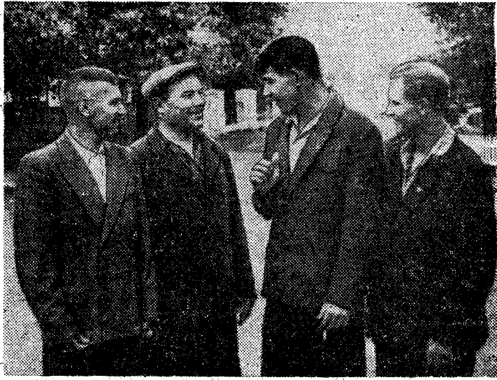
Горняки шестого участка одними из первых на шахте имени С. М. Кирова обсудили обращение ярославцев о развертывании соревнования за до-