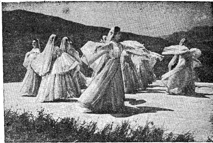
Ансамбль народного танца Дагестана «Лезгинка» готовится к большой поездке по стране. С творчеством этого молодого коллектива знакомы не только советские люди. Успешно прошли гастрольные ансамбля во Франции, ГДР, Чехословакии, Китае.