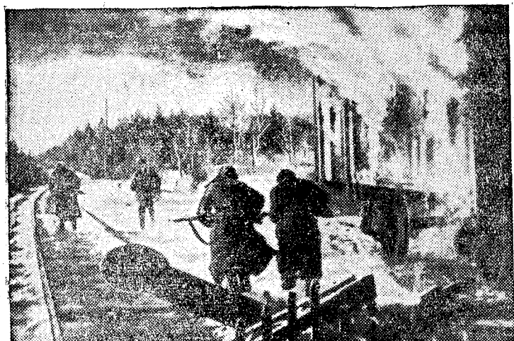
Исполнилось 20 лет со дня словацкого народного восстания. Эту дату широко отметил народ Чехословакии.

На снимке, сохранившемся от времен народного восстания, вы видите, как члены 2-й чехословацкой парашютной бригады штурмуют железнодорожную станцию Лопец (Центральная Словакия).