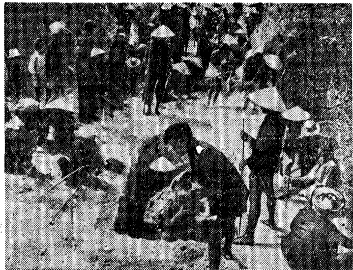
Южный Вьетнам. Жители районов, контролируемых Фронтом Национального освобождения, принимают активное участие в борьбе с войсками марионеточного правительства. Вокруг деревень они строят оборонительные сооружения, устраивают завалы и ловушки на дорогах.

Затем на торжественном заседании юбилейной сессии Народного Собрания Народной Республики Болгарии с приветственными речами выступили руководители партийно-правительственных делегаций братских социалистических стран, прибывших на празднование 20-й годовщины социалистической революции в Болгарии.