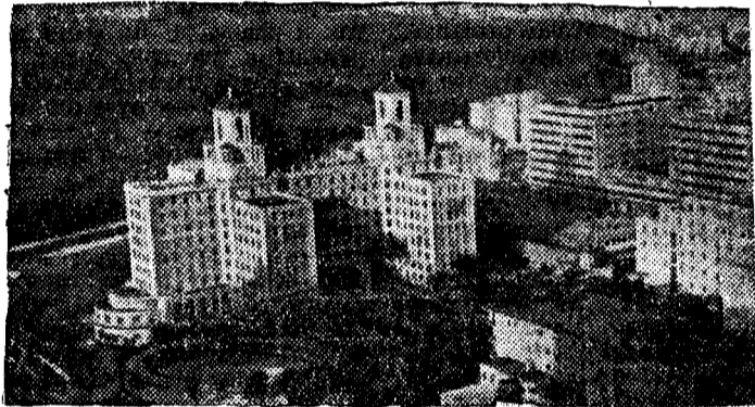
Гавана. Вид на бухту. На переднем плане «Отель Насиональ».