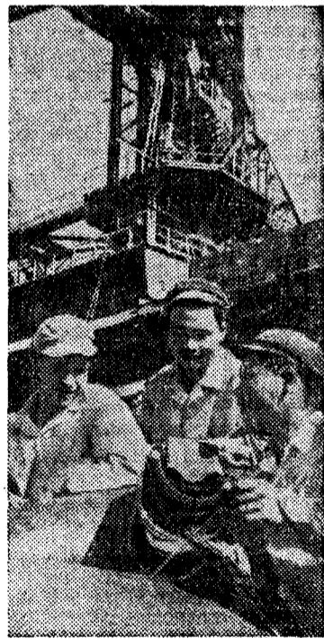
Демократическая Республика Вьетнам. Сварщики, работающие на строительстве Металлургического комбината Тхай Нгуен досрочно закончили сварку корпуса пылеотделителя доменной печи № 3.

Англия продолжает наращивать свои вооруженные силы у берегов Индонезии. Как сообщает газета «Дейли телеграф», в ближайше несколько дней в этот район для укрепления уже находящихся там военно-воздушных сил будет послано дополнительное число истребителей типа «Джвэлин». Отправлены также дополнительно и бомбардировщики. Отметим, что в состоянии оперативной готовности находят-