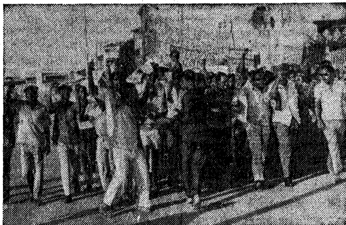
С антиимпериалистическими плакатами прошли колонны молодых занзибарцев мимо консульства США в Занзибаре. Участники демонстрации протестовали против вмешательства США во внутренние дела Конго. Тысячи людей провозглашали «Американцы домой!»

Англия сосредоточила сейчас в Юго-Восточной Азии наибольшее за последние 10 лет количество войск и техники, пишет корреспондент индийской газеты «Хинду» из Сингапура. Он подчеркивает, что корабли 7-го американского флота также стараются не удаляться от берегов Индонезии. (ТАСС).