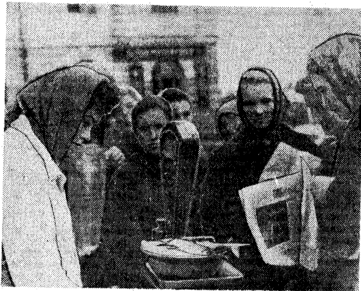
Нынешней весной труженики совхоза «Ленинголь» запустили в искусственный пруд мальков зеркального карпа. Прошло лето, вот результат — рыбы достигают 500 граммов каждая и больше. Сейчас рыбу отлавливают и продают в городской орс.

На этом снимке: торговля живой рыбой на площади Победы.