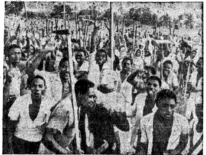
Плодородные земли Занзибара, которыми веками владели феодалы, переданы крестьянам. С огромным воодушевлением рабочие батраки идут работать на освобожденной земле.