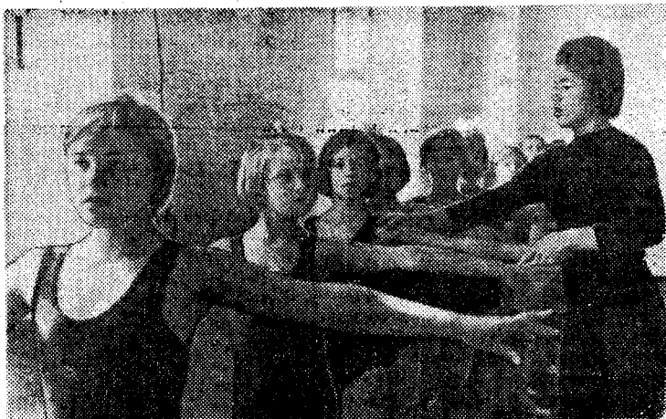
Недавно наша детвора получила замечательный подарок — Дворец пионеров. С первого же дня здесь начали работать различные секции. Особой популярностью у ребят пользуется секция юных гимнастов.