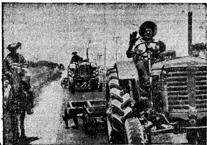
Работа венгерского фотокорреспондента агентства МТИ Ене Паппа «На кубинских дорогах». На Международной фотовыставке, устроенной в столице Республики Куба — Гаване, он завоевал золотую медаль.

черкнул, что прекращение торговых отношений с Кубой вызвало бы недовольство во французских деловых кругах. (ТАСС).